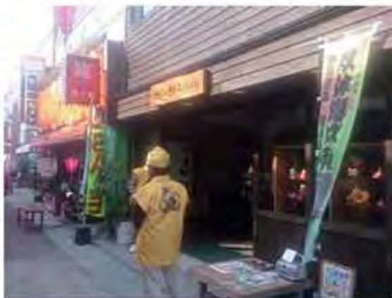
開運さが恵比須ステーション (1F)と学生向けシェアハウス (2F) 平成26年2月オープン