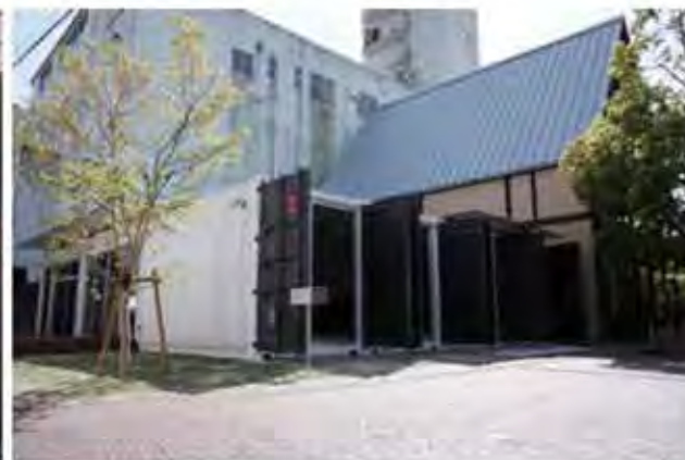
COTOCO215 平成26年4月オープン予定