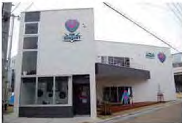
The Sagan 平成25年12月オープン