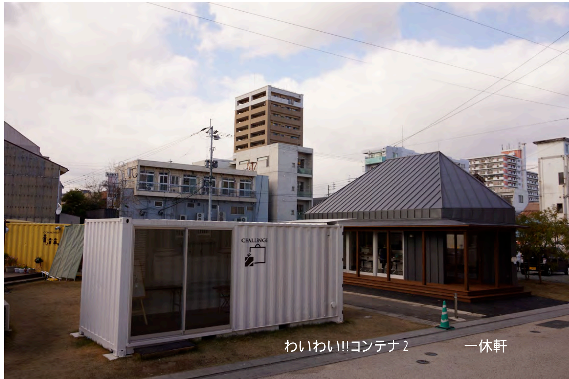
わいわい!!コンテナ2