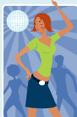
客にダンスをさせる営業