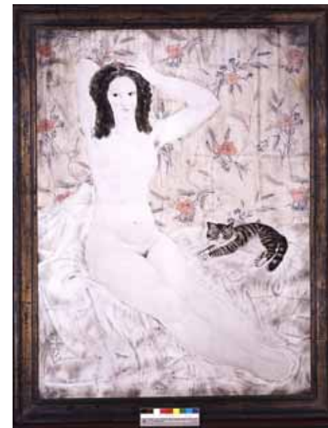
藤田嗣治 《タピストリーの裸婦》

新館移転期間中だった国際美の作品購入費の一部を京近美で使用し、藤田嗣治《タピストリーの裸婦》を購入。