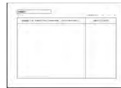
営業施設の大要 (平面図および案内図)