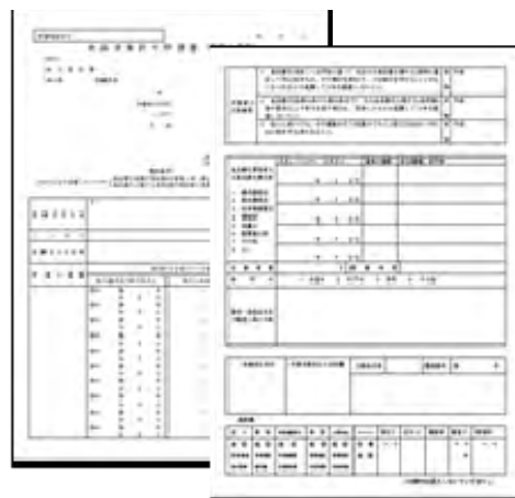
食品営業許可申請書