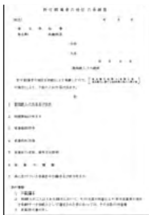
許可営業者の地位の承継届