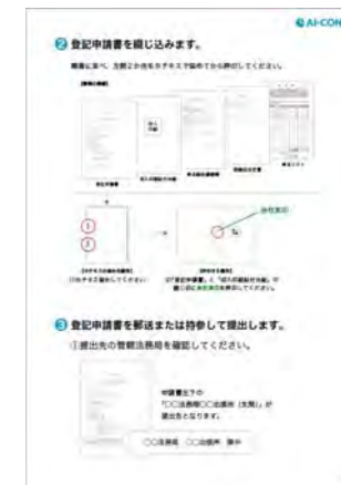
マニュアルサンプル