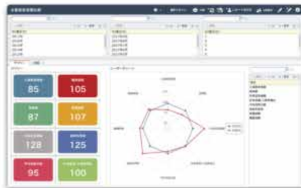
主要経営指標比較