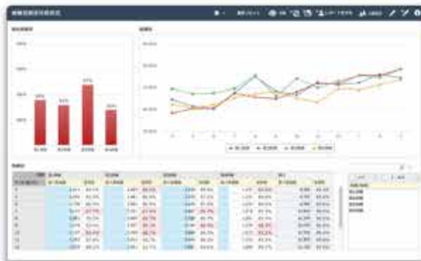
病床稼働状況分析