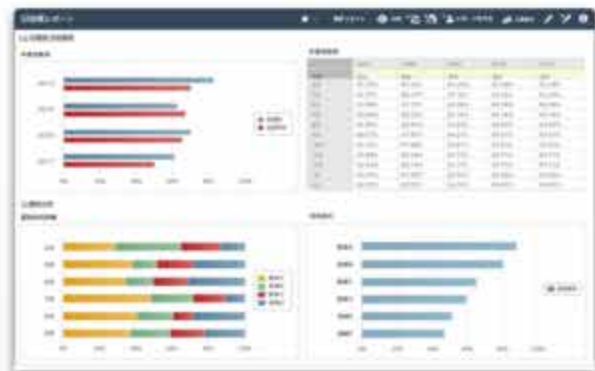
臨床指標の可視化