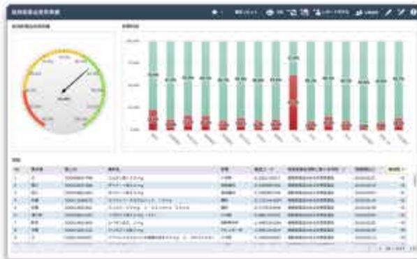
後発医薬品の使用分析