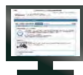
サイバー法人台帳 ROBINS