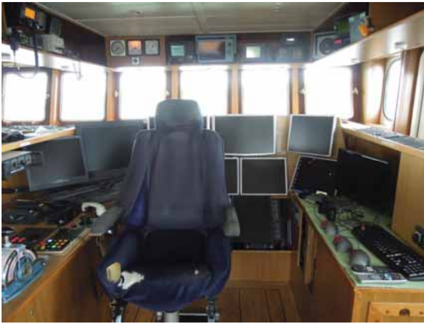
写真一12 北欧トロール漁船 操舵室