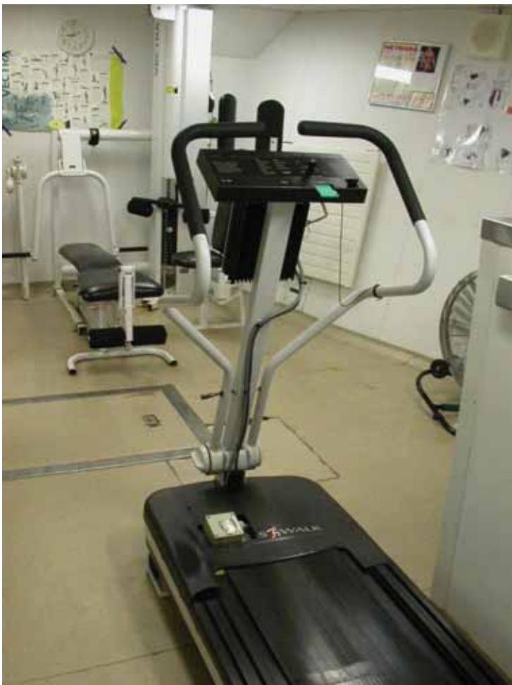
写真一11 北欧トロール漁船 ジム