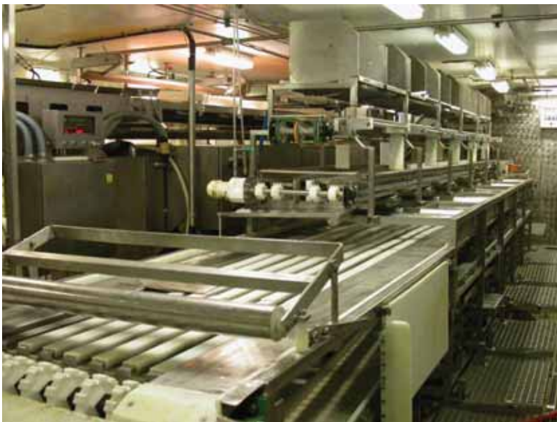
写真一22 北欧トロール漁船 清潔で自動化された加工場