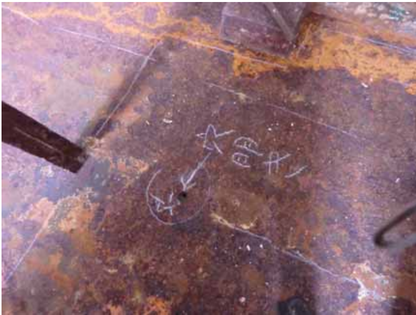
写真一4 大規模リニューアル工事漁船 木甲板下のデッキ (木甲板を外した状態)