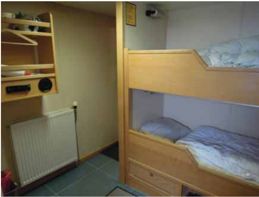
写真一10 北欧トロール漁船 居室（2人部屋）