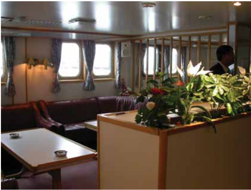
写真一七 北欧トロール漁船 サロン