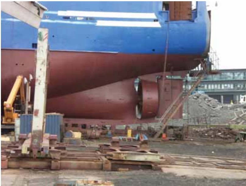
写真一15 北欧トロール漁船 船尾部