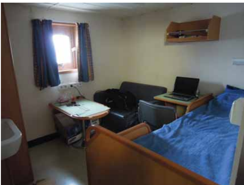
写真一九 北欧トロール漁船 居室（1人部屋）