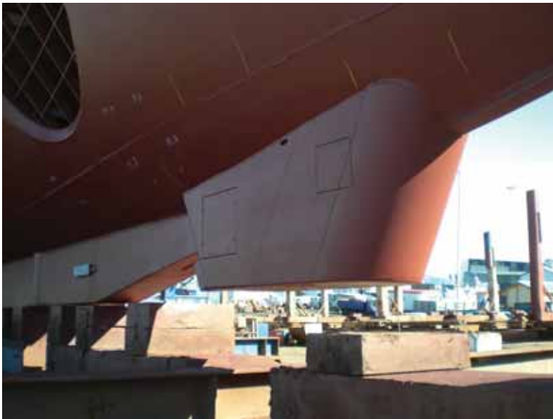
写真一21 北欧トロール漁船 魚網を監視するセンサー用の 船底ドーム