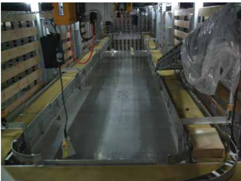
写真一23 北欧トロール漁船 魚倉内のコンベア 周回型で昇降式となっている。