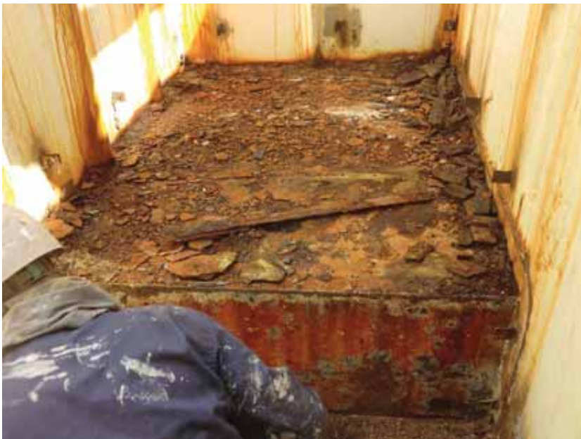
写真一5 大規模リニューアル工事漁船 漁具庫床のデッキ