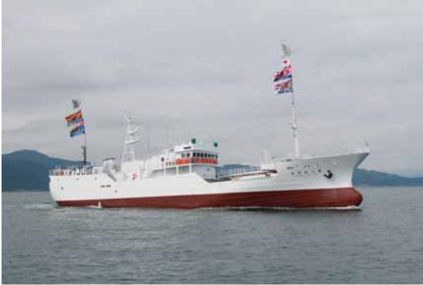
写真一 1 遠洋まぐろ延縄漁船