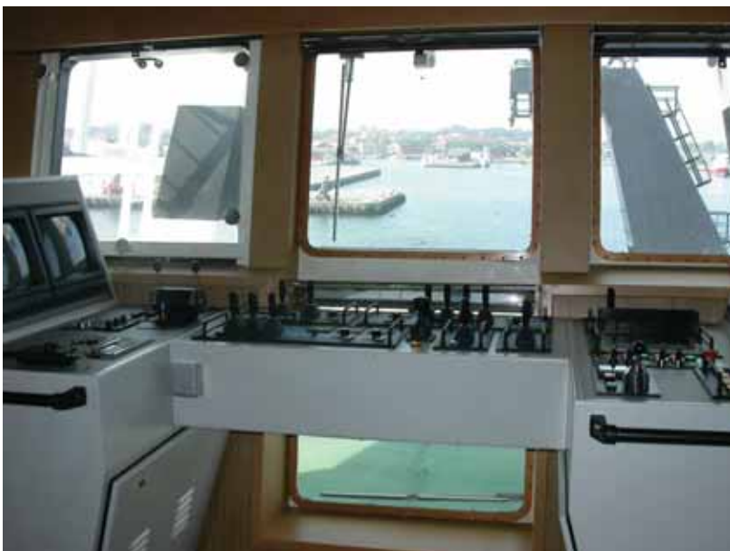
写真一14 北欧トロール漁船 ウィンチ操作盤 (操舵室内)