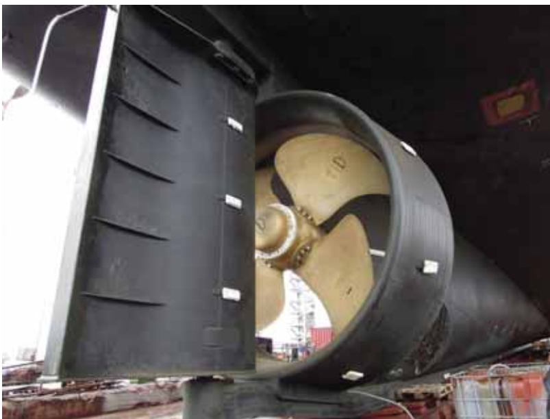
写真一16 北欧トロール漁船 コルトズル付プロペラ