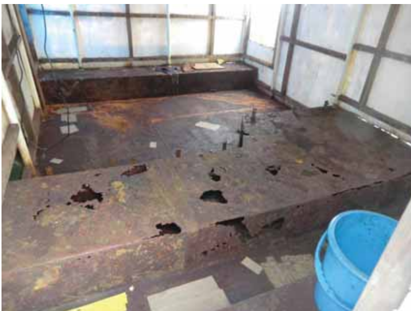
写真一6 大規模リニューアル工事漁船 架設倉庫内の通風ダクト