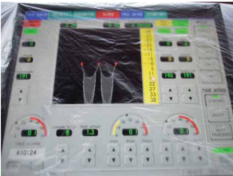
写真一20 北欧トロール漁船 魚網監視装置