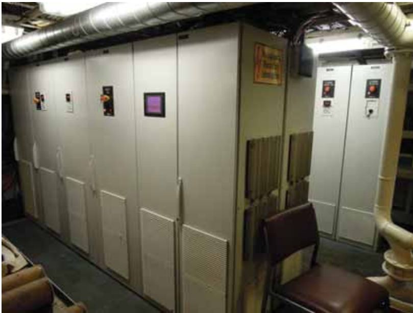
写真一18 北欧トロール漁船 インバータ盤 電動ウインチを制御する。