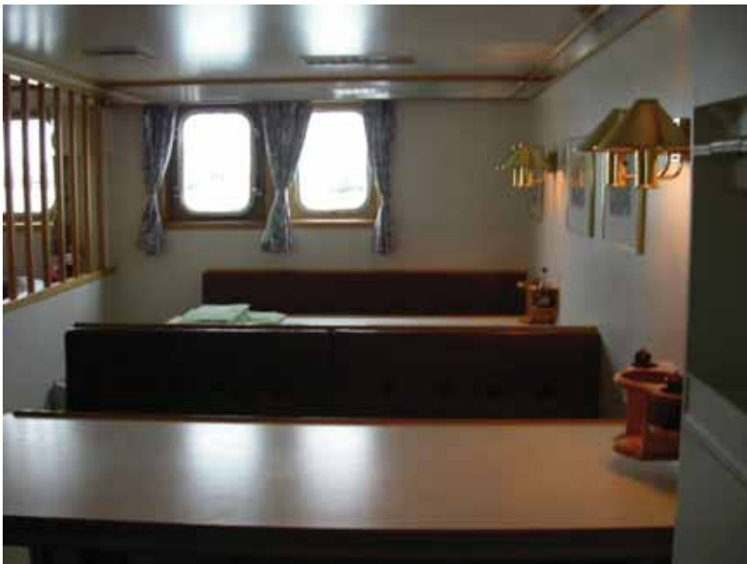
写真一八 北欧トロール漁船 食堂