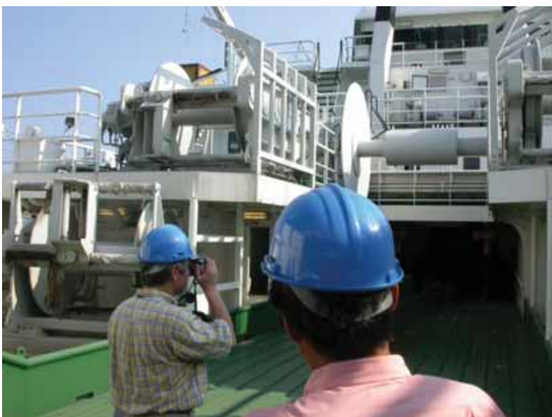
写真一17 北欧トロール漁船 漁撈装置 電動ウィンチ等