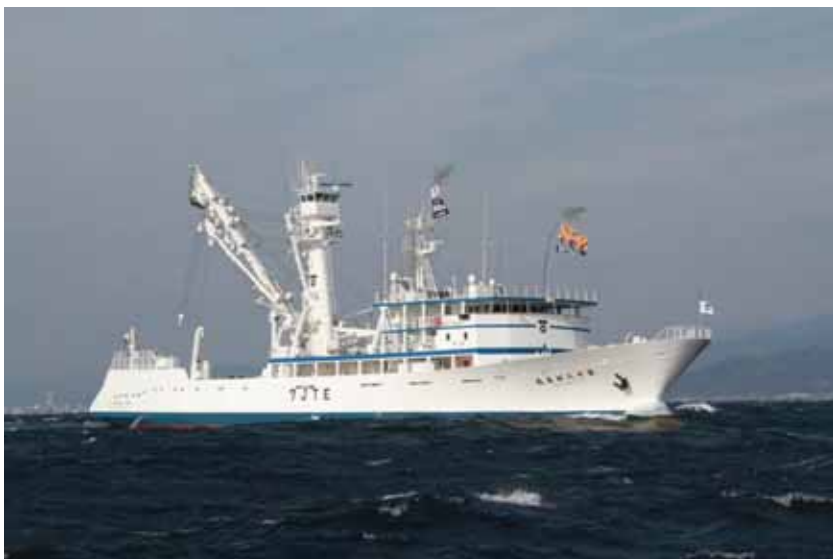
写真一 3 海外まき網漁船