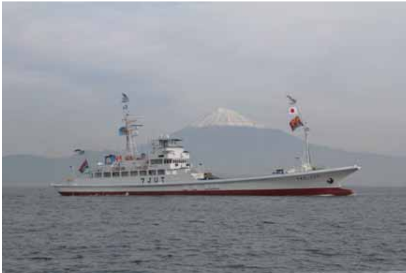
写真一 2 遠洋カツオ一本釣漁船