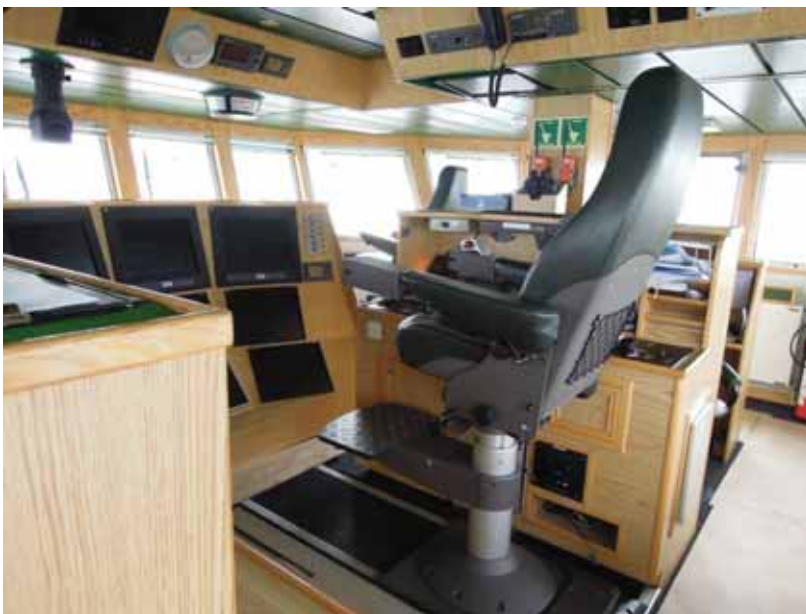
写真一13 北欧トロール漁船 操舵室