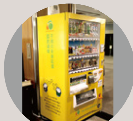
寄付型自動販売機