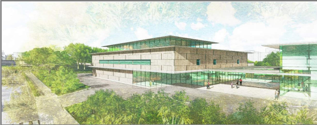
② 国立公文書館外観