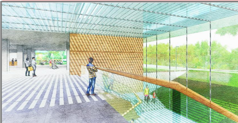
④ 大階段上部から皇居の緑を望む