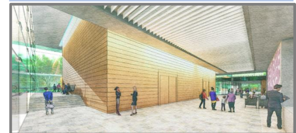
⑥ 講堂等利用者用エントランスホール