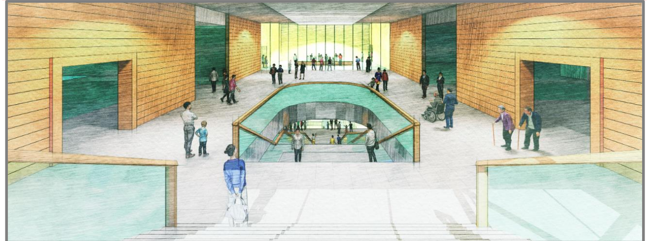
③ 地下1階 大階段を降りて正面のシンボル展示を望む