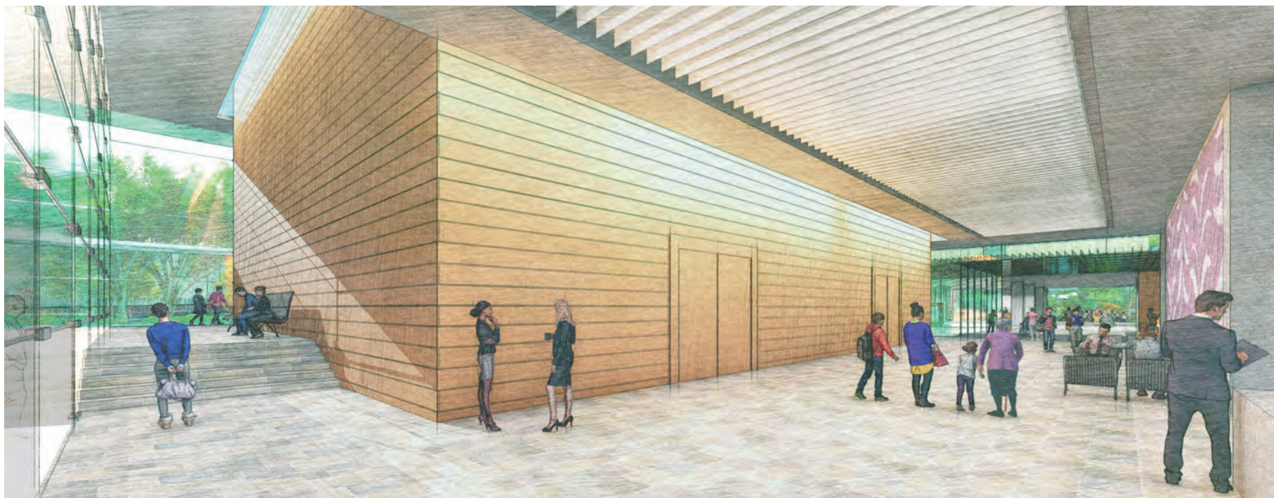
講堂・会議室利用者用エントランスホール

※現時点のイメージであり、今後の詳細検討により決定するものである。 ※施設を所管する衆議院事務局と、上記「基本設計の基本的な方向性（案）」を調整。