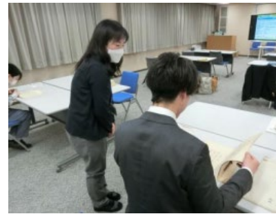
学習コンテンツの紹介と 資料の閲覧