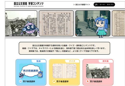
国立公文書館 学習コンテンツ