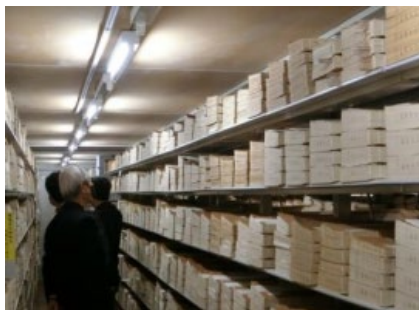
バックヤード見学