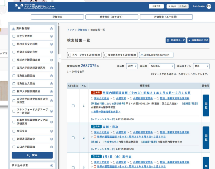
▲ アジア歴史資料センター www.iacar.go.jp