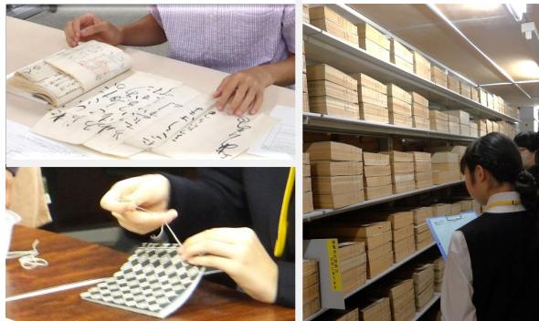
職場体験受入の様子