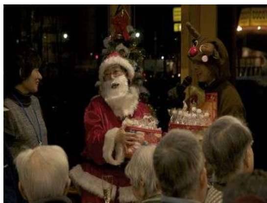
＜世代を越えて季節毎のイベント・行事＞