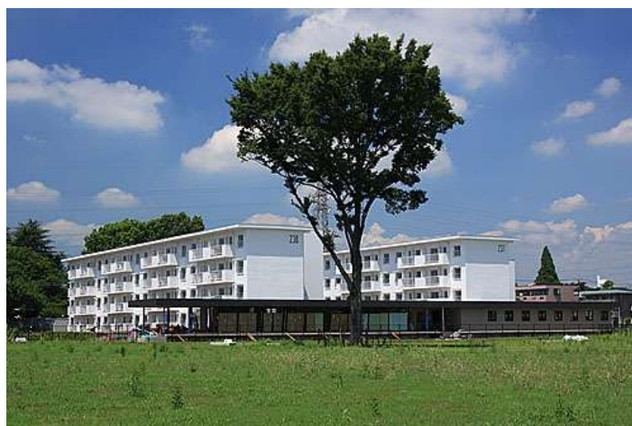
<「ゆいまーる多摩平の森」の全景>