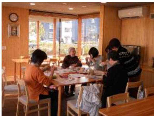
<若者に編み物を教える>