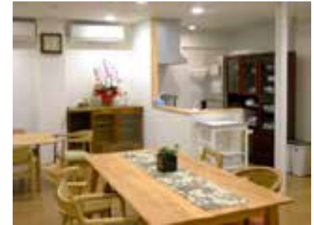
小規模多機能 ぐりーんは～と