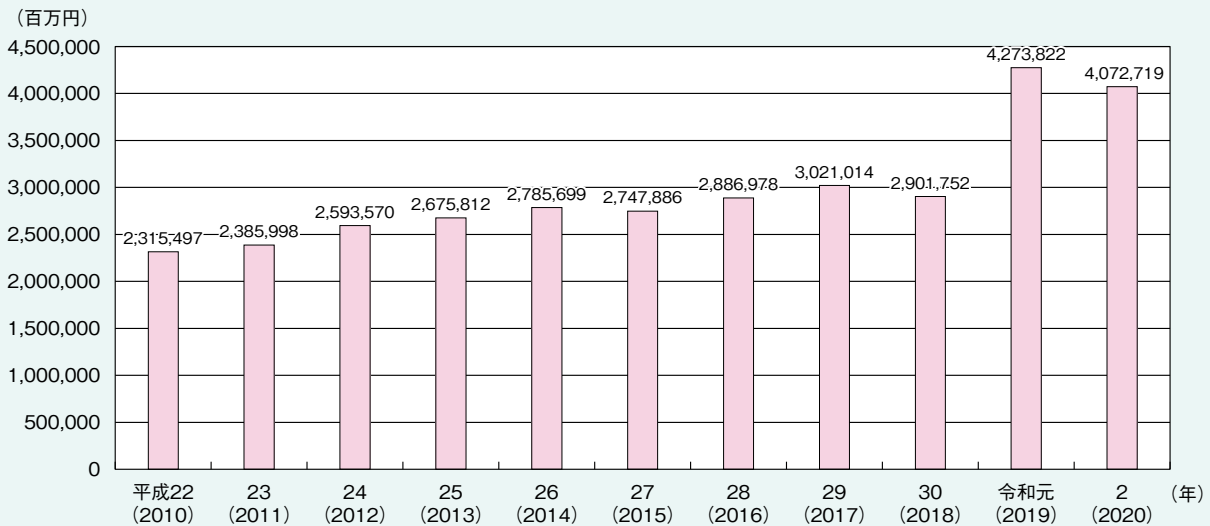
図1-2-4-1 医療機器の国内市場規模の推移

医療機器の輸出金額の推移を見ると、平成22年以降増加傾向にある。令和元年、令和2年は約1兆円となっている（図1-2-4-2）。