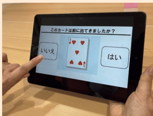
脳の健康度チェック「のうKNOW」