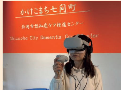
認知症のVR体験機器「VR認知症」

ケースが見られたり、認知症のVR体験（例：距離感がつかめなくなる「視空間失認」の症状の体験、認知症と診断された本人を取り巻く家族の体験）を通じて、認知症の症状や当事者の視点や立場について理解を深めるための機会を提供している。その他、普及啓発の取組として、認知症の理解や予防につながる講座やイベントを開催しているほか、最近では、若年層への周知・広報に力を入れており、小学生向けのイベント、高校生の職業プログラム、大学生向けのVR体験会も実施している。