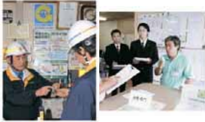
全国貨物自動車運送適正化実施期間 社団法人 全日本トラック協会 発行 『適正化事業の概要』より