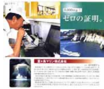
『ゼロの証明。』 『ゼロの証明。』 『ゼロの証明。』