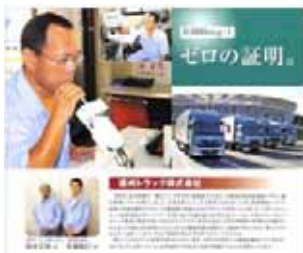
バス・タクシー・トラック・鉄道・航空・一般企業 (すべて任意の選択、独自の運用)