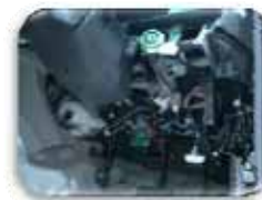
取り付け位置 (ハンドル付近のパネル内)