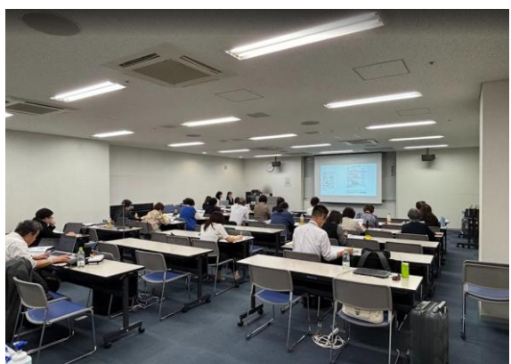
活動事例発表の様子