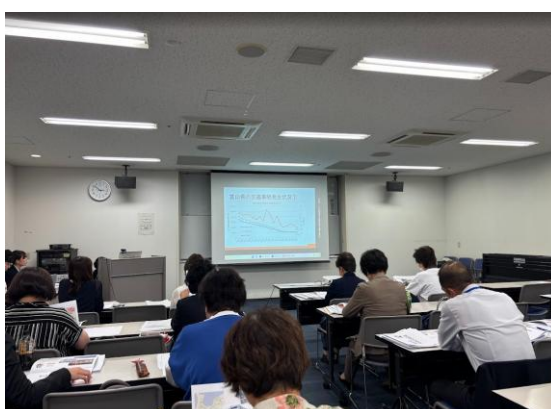
活動事例発表の様子