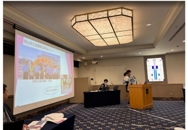
活動事例発表の様子