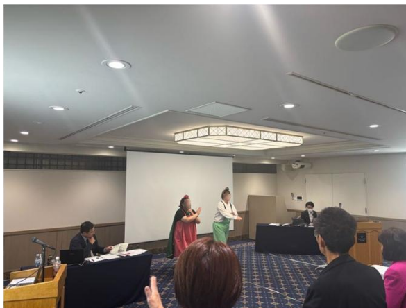
活動事例発表の様子