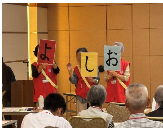
活動事例発表の様子