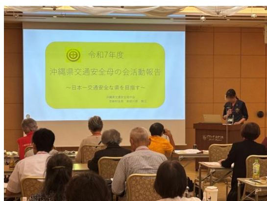
活動事例発表の様子