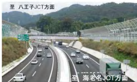
圏央道(相模原愛川IC~高尾山IC) (※8)