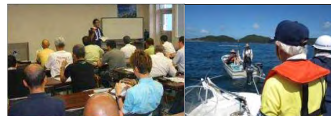
小型船舶操縦士免許取得講習会等を利用した海難防止思想の普及 海上安全指導員と海上保安官による合同パトロール