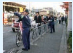
高校生に対する自転車通行ルールの街頭指導