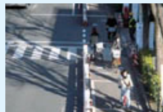
中杉通り自転車道社会実験結果報告書より

このような中で、東京都では、杉並区と協力し、歩行者、自転車及び自動車のそれぞれが安心して利用できる道路空間を確保するため、既存