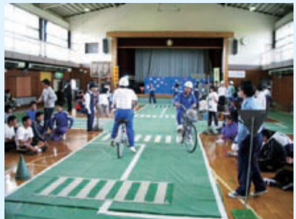
自転車教室の開催