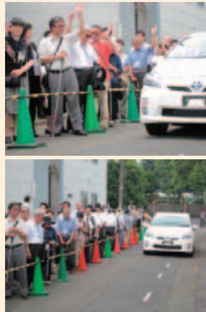
ハイブリッド車を用いた体験会の様子

その結果、平成22年1月、委員会は「ハイブリッド車等の静音性に関する対策について(報告)」を取りまとめ、運転者が最善の注意を払って歩行者に危険を感じさせないように運転することも重要としながらも、それだけでは歩行者の予期せぬ行動に対応できないとして、ハイブリッド車等の優れた静音性能を活かしつつ、視覚障害者を含む歩行者が車との位置関係を的確に把握できるようにするため、一定の要件を満たした発音装置をハイブリッド車等に装備することを求めた。