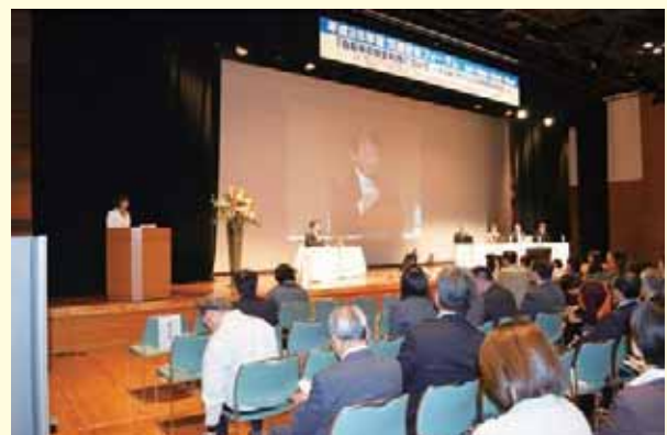
（パネルディスカッション開催状況）