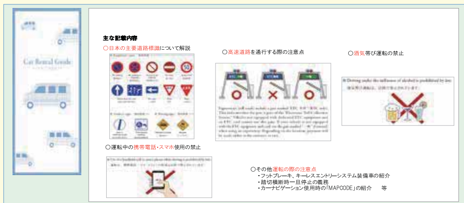
パンフレットによる日本の交通ルール等の周知

また、一般社団法人全国レンタカー協会は、外国人が運転していることを周囲のドライバーに示す、専用ステッカー作成の取組を行っている。