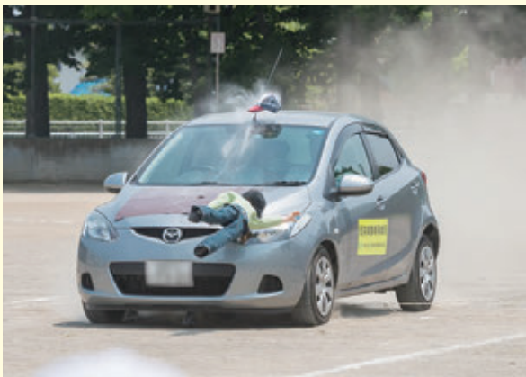
交通事故再現実験の様子