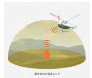
もしもの時のココヘリの仕組み