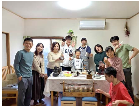
「くるみのおうち」で 開催された珈琲焙煎講座 (2020年10月23日、川崎市)