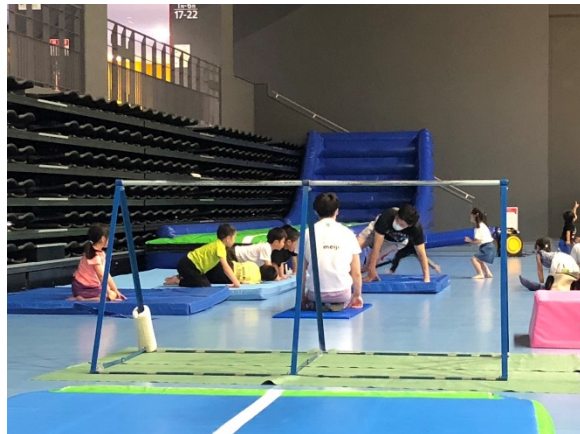
子ども体操教室 (2020年6月、帯広市)