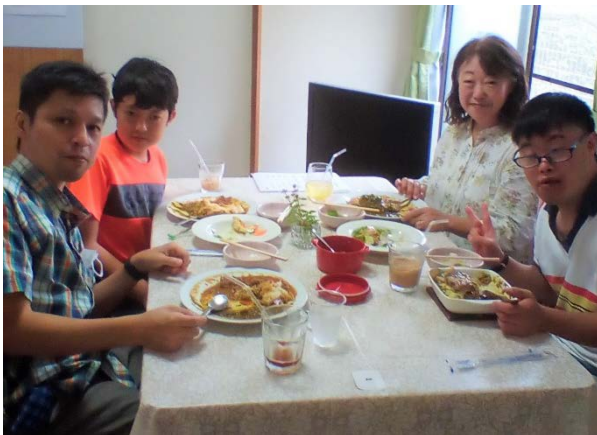
「くるみのおうち」で 開催されたカレーイベント (2020年9月29日、川崎市)