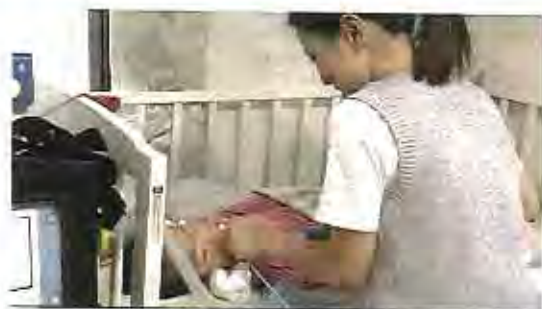
ハードネットTV 「高齢者のケア」特集とともに、第1回「認知症の悩み」