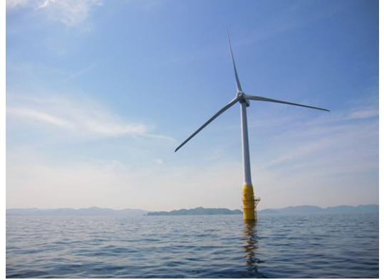
洋上風力発電機

洋上風力発電の計画的・継続的な導入拡大とこれに必要な関連産業の競争力強化、国内産業集積、インフラ環境整備等を官民が一体となる形で進め、相互の「好循環」を実現していくため、「洋上風力産業ビジョン（第1次）」を策定し、2030年までに1,000万kW、2040年までに3,000万kW～4,500万kWの案件形成を掲げるなど意欲的な目標を掲げており、洋上風力発電の導入促進へ向け、ますます取組を加速させています。