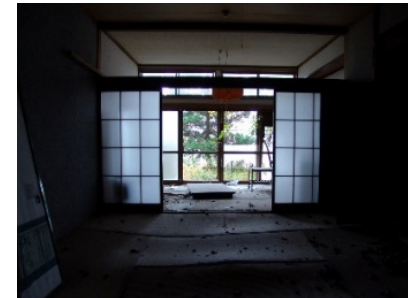
老朽化したホテル・旅館の改修