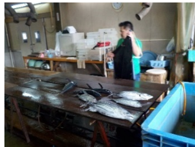
水産加工場の整備・改修・増設