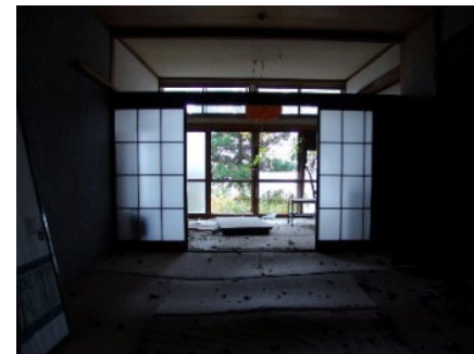
老朽化したホテル・旅館の改修