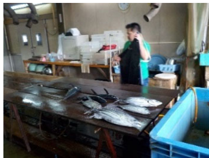
水産加工場の整備・改修・増設