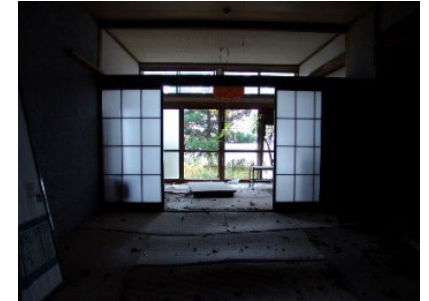
老朽化したホテル・旅館の改修