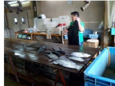
水産加工場の整備・改修・増設