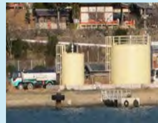
・離島における油槽所