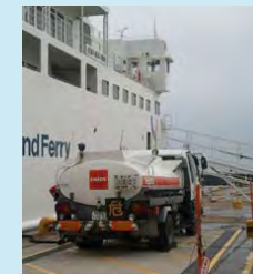
・フェリーに乗るローリー