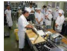
【学校給食向け講習会】

国産水産物の展示・発表会の開催 学校給食関係者等向けのセミナーの開催 栄養教諭等が活用する魚食に係る資料の作成・研修会の開催 小売・外食事業者向け研修会