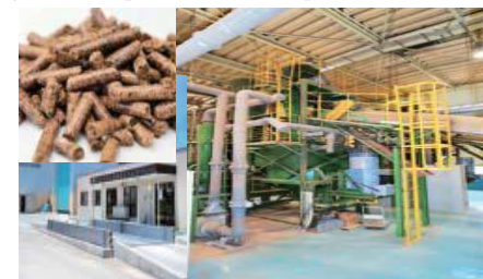
廃棄物処理施設