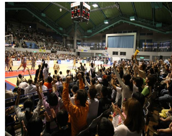
プロスポーツ運営