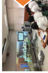
与那国町 (イメージ)