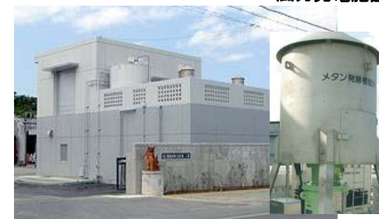
泡盛蒸留粕高度利用設備