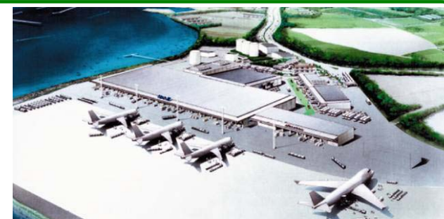
那覇空港新貨物ターミナル