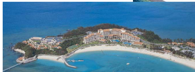
万国津梁館周辺施設整備