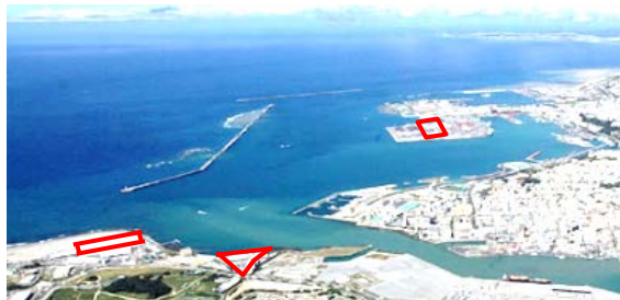
那覇市内の国際物流拠点産業集積地域 (線で囲まれた部分。左から那覇空港地区、那覇地区、 那覇港地区)