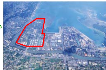
国際物流拠点産業集積地域中城湾港新港地区 (線で囲まれた部分)