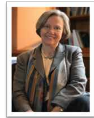
Shirley Tilghman # Princeton

* Nobel Laureate # Former University President $ Former/current Institute Director @ Former/current University Vice President