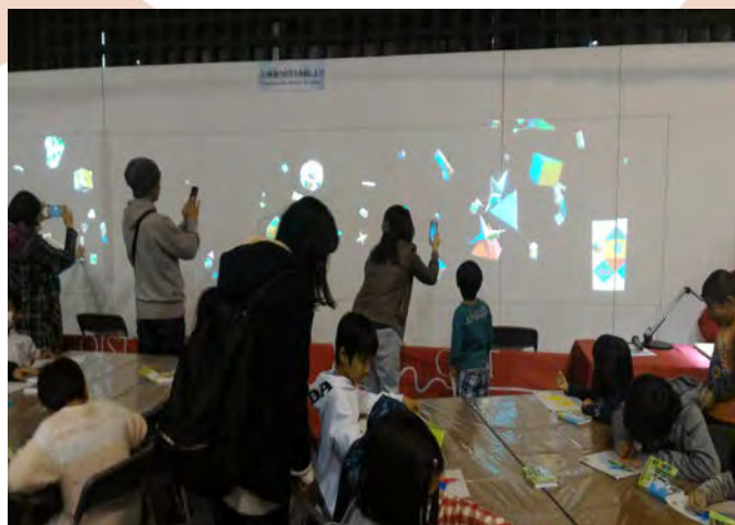
沖縄電力青少年科学作品展での出展 Youth Science Exhibition by Okinawa Electric Power Company