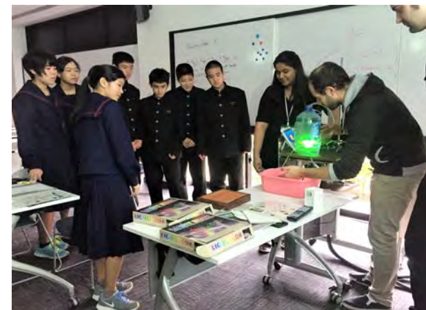
研究員による地元中学校での出前講演 Lectures at schools by researchers