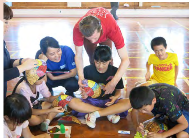
宮古島での出前授業「サイエンストリップ」 Science lecture in Miyako island "Science Trip"