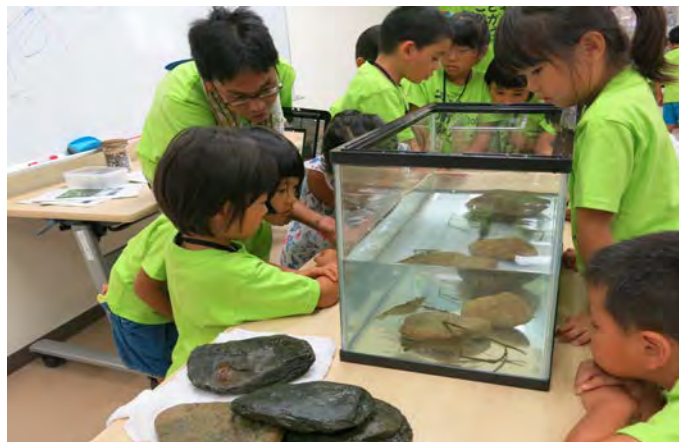
こどもかがく教室2018 Children's School of Science