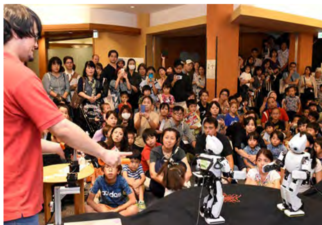
サイエンスフェスタ2018 Science Festa 2018 来場者：4500人以上 Over 4500 Participants