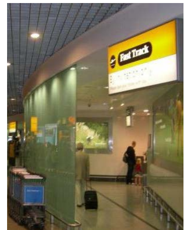
【参考】 ロンドン・ヒースロー空港のFast Track