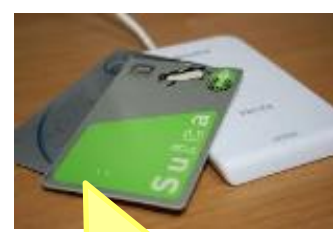
ネームカード発券時にSUICAを個人とリンク付け