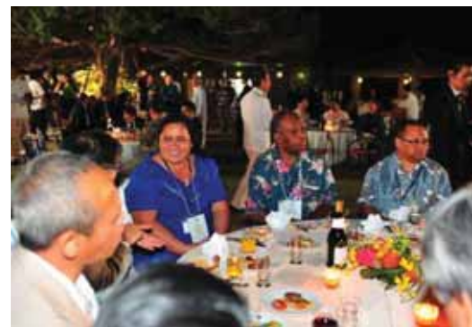
首里城公園(芝生広場)でのウェルカムレセプション