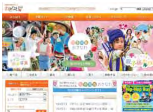
沖縄観光情報ウェブサイト http://www.okinawastory.jp/