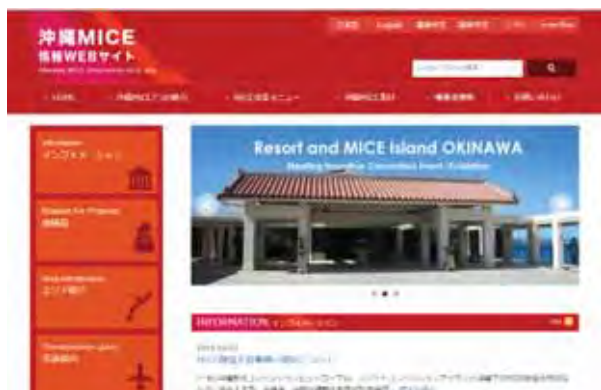
沖縄MICE情報ウェブサイト http://mice.okinawa.lg.jp