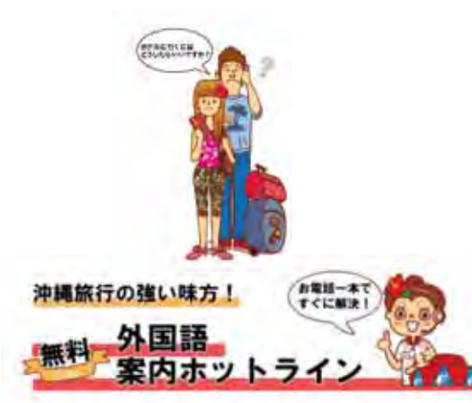
沖縄多言語コンタクトセンター (英・中・韓) http://www.visitokinawa.jp/oin/support/335