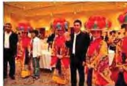
祝賀レセプション