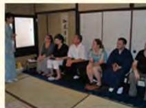
旅行会社の現地視察 (京都) (米国の例)