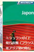
ミシュランガイド 発行支援 (フランス) ※アジア初の発行

現地関係団体との連携イベントでの情報提供 (現地旅行博での日本食を通じた訪日観光PRの例)