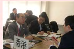
海外事務所長による市場説明/個別相談