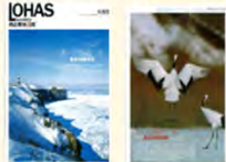
中国映画『非誠勿擾』ロケ地ツアー (北海道) の提案