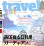
英国有力日刊紙ガーディアン ※2011年読者満足度ランキングで日本が1位