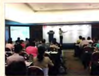
訪日教育旅行セミナー (シンガポールの例)