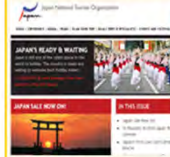
ニュースレター (ロンドン事務所)