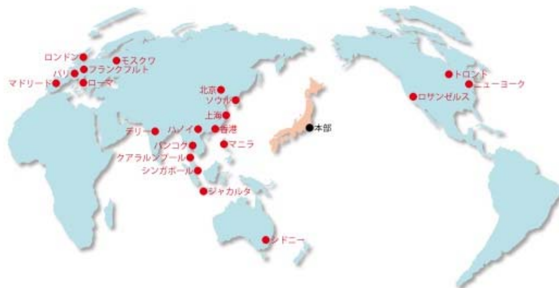
JNTOの海外事務所ネットワーク