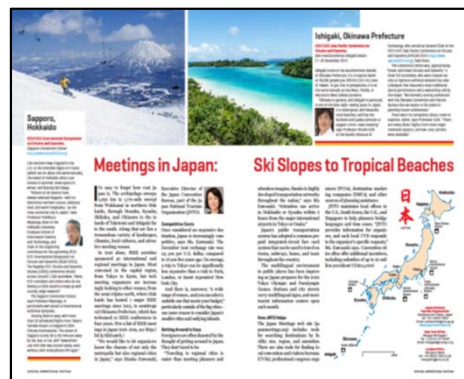
国際団体会員向け媒体