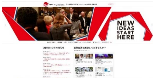
国内向けウェブサイト