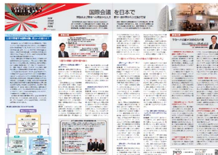
メディカルトリビューン