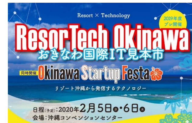
JNTOのSNSやMICEアンバサダー向けニュースレターで紹介予定