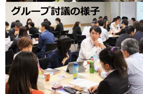
グループ討議の様子